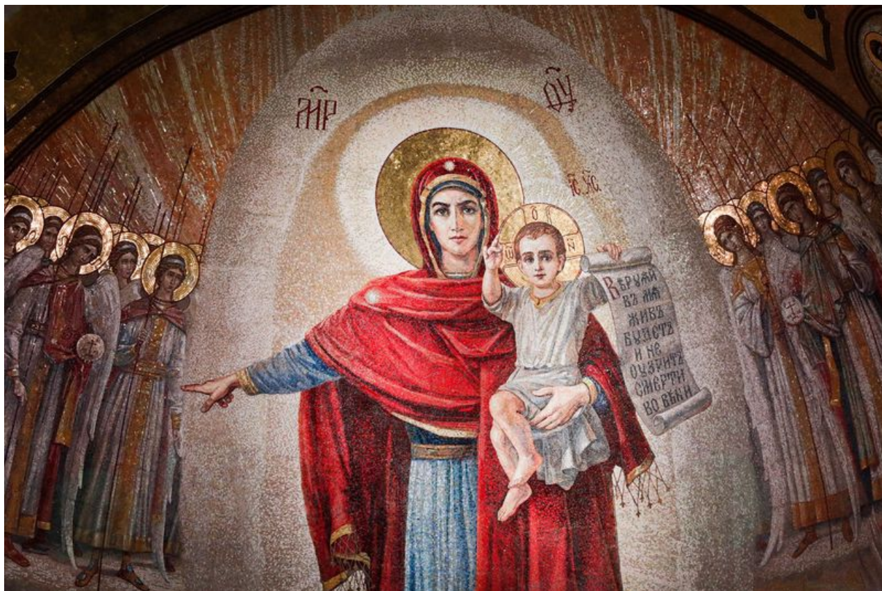
Образ Богородицы в стиле рисунка "Родина-мать зовет", главный храм ВС РФ

Но и множество других вопросов можно задать Британии: зачем она выводит интеллигенцию и профессиональные кадры из России за рубеж, зачем обесценивает национальный курс рубля, зачем держит не малую прослойку в обществе России в бедности, зачем всячески понижает рейтинг России на международной арене, зачем создает проблемы в постсоветских странах, зачем обворовывает россиян, выводя капитал и так небогатых граждан через мошеннические финансовые организации на британские офшорные государства, почему не запрещает своим офшорным островным странам воровать деньги в других странах?