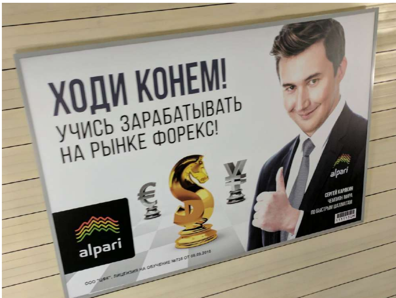
Рис 1. Рекламный баннер Alpari

На рисунке 1 содержится реклама Alpari. На баннере нет информации, что рекламируются услуги на форекс российской организация Общество с ограниченной ответственностью "Альпари Форекс" с лицензией Банка России № 045-14003-020000.