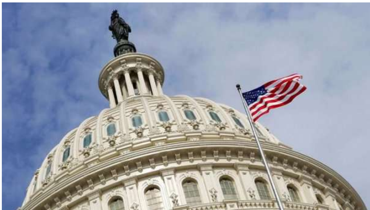
Закон Додда — Франка о запрете Форекс

С 15 июля 2011 года действовали ограничения закона Додда — Франка (англ. Dodd–Frank Wall Street Reform and Consumer Protection Act), согласно которому для граждан США (физических и юридических лиц) запрещаются внебиржевые сделки с финансовыми инструментами. Согласно ограничениям закона, любые торговые операции резидентов США с финансовыми инструментами на внебиржевом рынке отныне будут квалифицироваться как противозаконные. Через 90 дней после вступления в силу закон Додда—Франка запрещает гражданам и компаниям проведение большинства операций на внебиржевом рынке, в том числе Форекс.