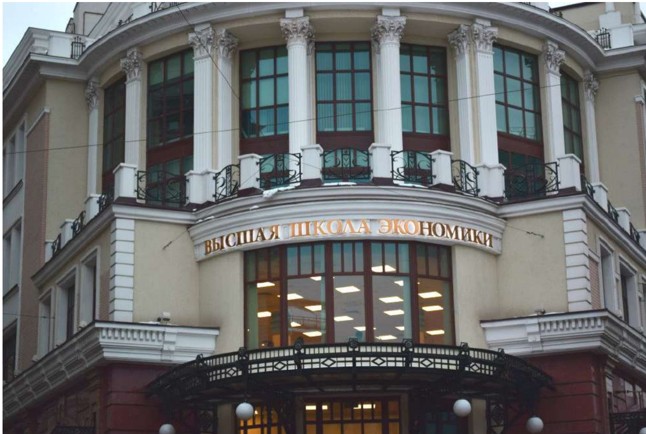
ВШЭ о Форекс (Forex)