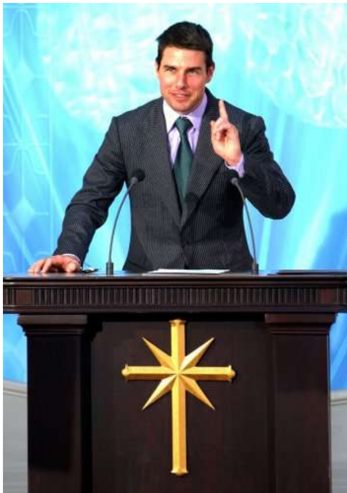
Рис 1. Деловой этикет секты саентологов